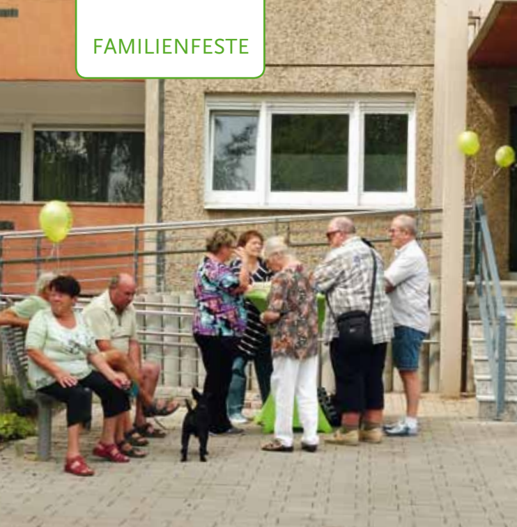
TAG DER OFFENEN TÜR IM KLUBRAUM KÖRNERSTRASSE | 24. AUGUST 2018