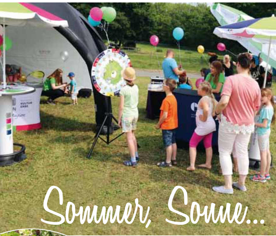
KINDERFEST IM THÜRINGER ZOOPARK 27. MAI 2018

Am Sonntag, dem 27. Mai 2018, feierte der Thüringer Zoopark Erfurt ein großes Kinderfest. Neben einem bunten Bühnenprogramm erfuhren Klein und Groß viel Wissenswertes über die Zootiere. Der Regionalverbund der Erfurter Genossenschaften und die WBG "Erfurt" und Einheit unterbreiteten den kleinen Besuchern viele Angebote, so z.B. konnten sie sich schminken lassen, ihr Glück am Glücksrad versuchen und ausgelassen auf der Hüpfburg toben.