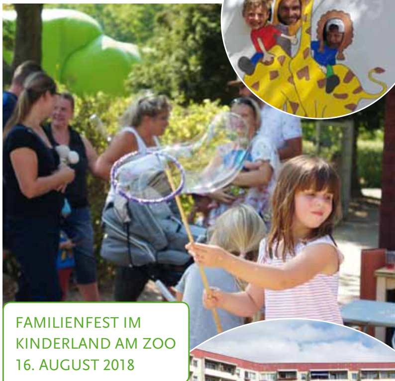
FAMILIENFEST IM KINDERLAND AM ZOO 16. AUGUST 2018