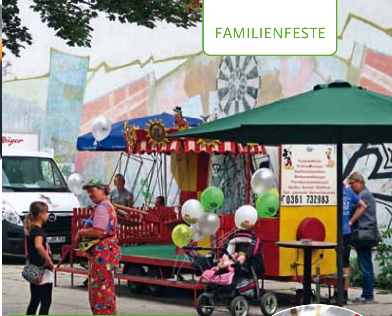
BEROLINAFEST 18. AUGUST 2018