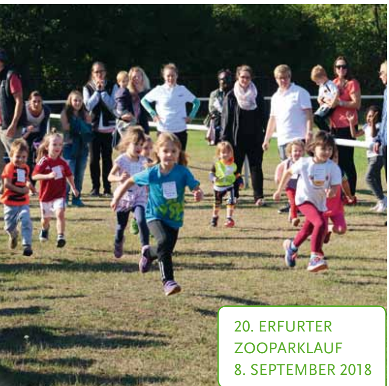
20. ERFURTER ZOO PARKLAUF 8. SEPTEMBER 2018