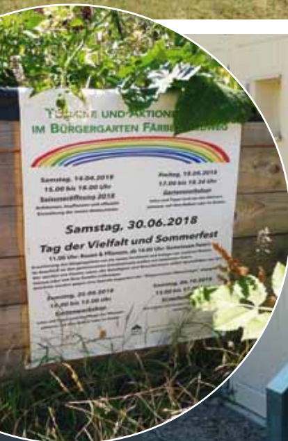
TAG DER VIELFALT | 30. JUNI 2018

Bei schönstem Wetter wurde am 30. Juni 2018 das Sommerfest im Bürgergarten im Ortsteil Wiesenhügel im Zusammenspiel mit dem „Tag der Vielfalt“ gefeiert. Die Akteure wollten mit diesem Fest Signale für Toleranz und Weltoffenheit setzen. Auch unsere Genossenschaft war mit dabei.