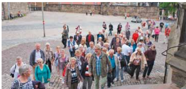
Die Besichtigung des Doms und eine Schifffahrt auf der Regnitz standen auf dem Programm.