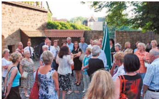
Führung auf dem Gelände des Augustinerklosters